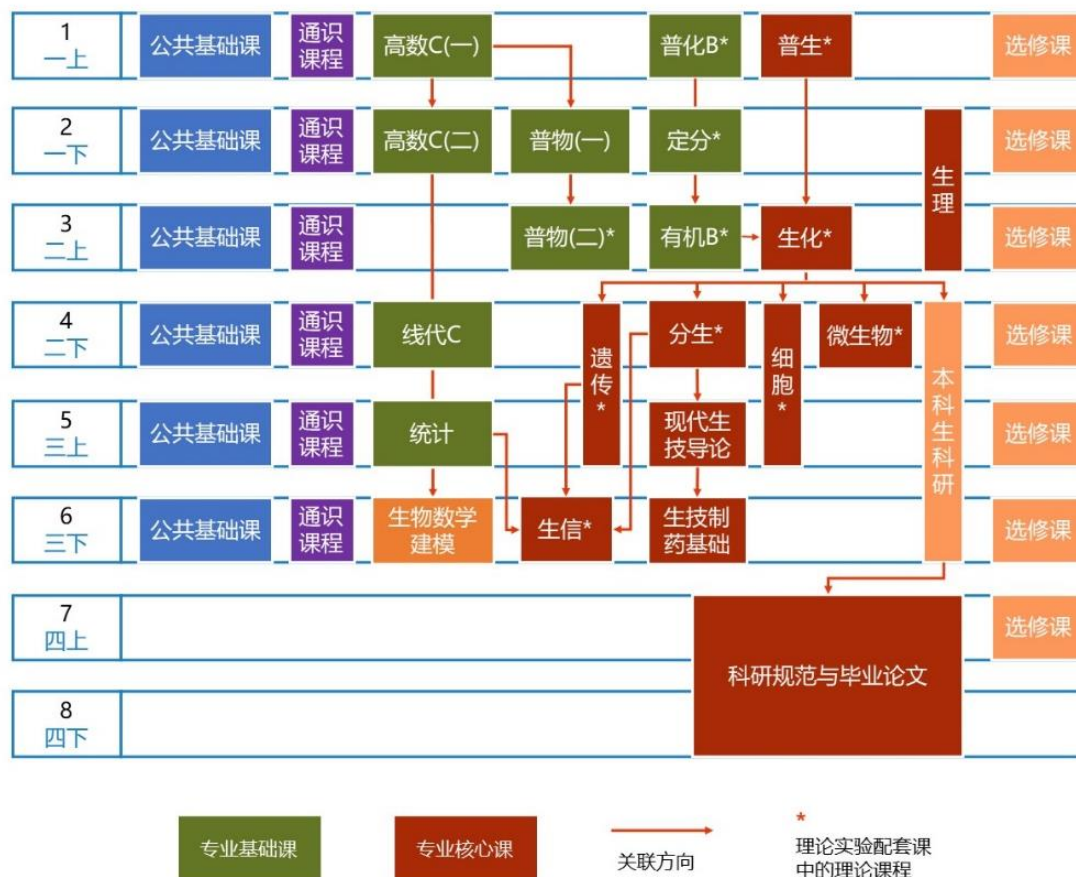
生物技术专业课程地图